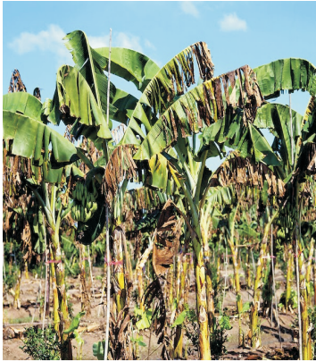
வாடல் நோய் தாக்குதல்

இவை ஒவ்வொன்றும் 5 கிலோ அளவில் சேர்க்கப்பட்டுள்ள 40 கிலோவை சுமார் 200 கிலோ தொழுவரத்துடன் கலந்து நடவு வயலில் சீராகத் தூவியோ அல்லது குழிகளில் சுமார் 250 கிராம் இட்டோ பயன்படுத்தலாம். இவை கன்றுகளின் வளர்ச்சியை ஊக்குவிப்பதுடன் மண் மூலம் பரவும் வாடல் நோயையும் நூற்புழுக்களையும் கட்டுப்படுத்தும். இதைப் பயன்படுத்தினால் இரசாயன அடியுரத்தை தவிர்க்கலாம். மேலும் பின்னர் இடும் இரசாயன மேல் உரத்திலும் பரிந்துரை செய்யப்பட்ட அளவில் தழை, மணி, சாம்பல் சத்துக்களில் ஒவ்வொன்றிலும் சுமார் 30 சதவீதம் குறைத்து இட்டு முழு உரமிட்ட மகசூலைப் பெறலாம். சிலிகா மற்றும் சிங்க் சத்தும் பயிருக்கு கிடைக்கின்றது. தண்ணீரில் உயிர் உரங்களைக் கலந்து சொட்டு நீர்ப்பாசனம் வழியாக வயலுக்கு அளிக்கலாம்.