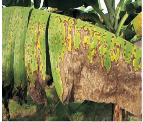
இலைப்புள்ளி நோய் தாக்கிய இலை

வாழையின் இலைகளை சிகடோகா இலைப்புள்ளி நோய்தாக்குகின்றது. இந்நோய் இலைகளின் மேல் சிறு புள்ளிகளாகத் தோன்றி மஞ்சள் நிறமுடைய நீண்ட புள்ளிகளாக மாறும். பின்னர் இவை ஒன்று சேர்ந்து இலை முழுவதும் சருகாகிவிடும். இலைக் கருகல் மற்றும் கருமுனை நோய் இலைகளையும் பழங்களையும் தாக்குகின்றது.