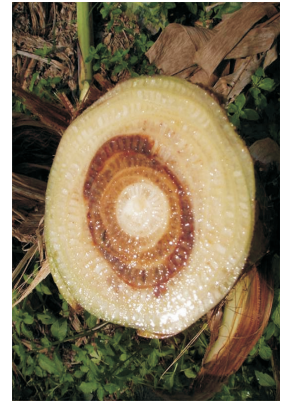
வாடல் நோய் தாக்குதல் தண்டு வெடித்தலும், நிறம் மாறுதலும்